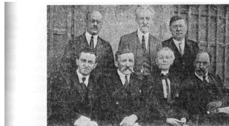
Члени Термінологічної комісії Української господарської академії в Подєбрадах. Середина 1920-х рр.